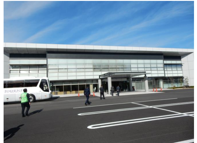
【茨城県トラック総合会館の外観】

実は今年7月8日の茨ト協青年部会の総会に出席する機会があり、その時はじめて茨ト協青年部会のメンバーもこの新会館の見学会を行いました。30人~40人ほどの出席者でしたが、見学の列の最初と最後では、離れてしまい、説明者も一人だった為、声が聞き取れなかったりしました。茨ト協青年部会の幹部の方々が「これは研修会の時の課題だな。」と言っていました。