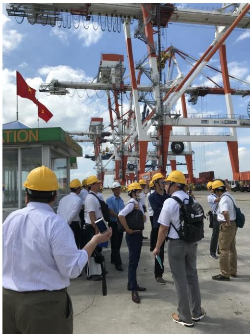
【カイメップチャーバイ港視察の様子】

ここからトラックで輸送される貨物は 15% ほど。この割合の少なさが、ホーチミン市内へ向かう幹線道路の渋滞や、陸路による輸送ルート (国道整備) の不拡充に起因するものであったことは、これより後の研修行程の中で知りました。