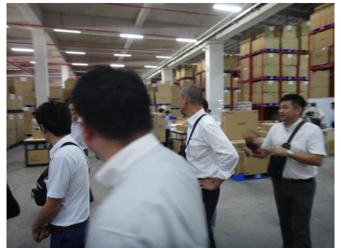
【佐川ベトナムの倉庫施設視察】

これは多くの受取主が日系企業であることが理由で、一般の個人宅に届ける事案はまだ少ないようです。