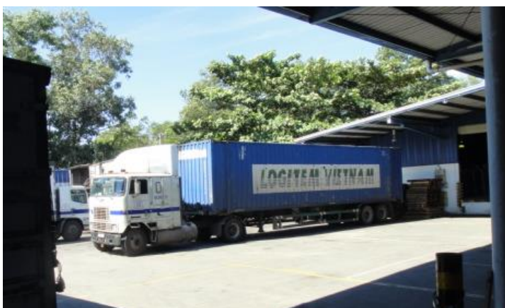
【ロジテムベトナムのトレーラー】

雇用面において、最低賃金が上昇し続けている (年 8%~10%) ことにより、賃金が社内規定で 6% くらいずつ上がっている点や、ベトナム人の勤勉な気質というイメージは女性にはあてはまるが、男性は楽に稼ぎたいという姿勢の方が多きことなどがお話のなかで印象的でした。