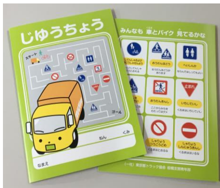
【配布した「じゅうちょう」】

板橋支部青年部では本年も、板橋区の公立小学校51校に入学する新入学生徒3,945名を対象に、交通標識を表紙に記載した自由帳配布を3月の春休み前後に行いました。配布は板橋支部青年部員が分担して行い、自分の子どもも貰った記憶があると喜びながら言っておられた学校職員の方もいて、ノート配りの伝統と継続の成果を噛み締めながらの活動でした。無事に配布が完了した後、板橋区教育委員会へ報告した際に教育長より感謝状を頂き、面談の機会を設けて頂きました。その中で、小学生の痛ましい交通事故のお話から、ノート配りの継続だけでなく教育委員会で何か求めている物が無いかといった意見を伺いつつ、交通安全啓蒙活動の更なる発展にはどうすべきかを、面談に参加した青年部長及び副部長だけでなく青年部全体で検討していこうと思いました。本活動は諸先輩方の時より、子ども達にトラックを知ってもらう、